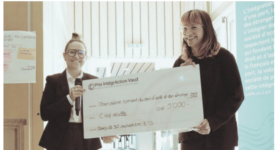
Remise du prix IntégrAction, 30 septembre 2023

Pour cette recherche, l'ODAE romand a reçu le prix IntégrAction 2023 de la Chambre Cantonale Consultative des Immigrés du canton de Vaud.