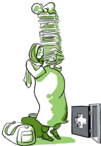
illustration: Léandre Ackermann, Panorama n°5, mai 2023.

Le 6ème dossier Panorama «Quand le statut fait la peine: la détention des personnes étrangères en Suisse» est paru en décembre et aborde les enjeux de la détention (administrative, avant jugement, en exécution de peine), leurs imbrications et les différences de pratiques cantonales, ainsi que les processus qui y conduisent, de façon disproportionnée, les personnes étrangères.