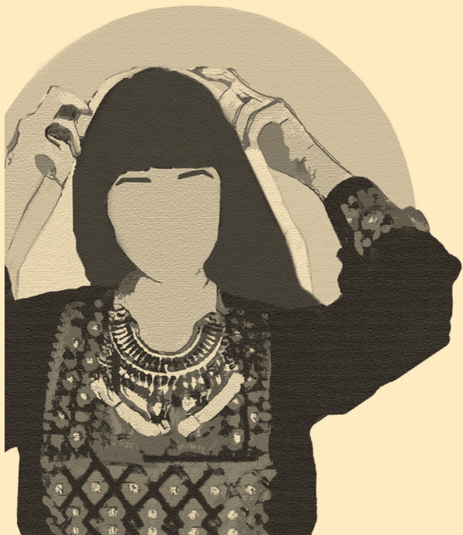
« Palestinian Beauty », œuvre de Nour Ziada.

Malgré l'adhésion de la Suisse (en 1972) à la Convention de 1954, la protection des droits des personnes apatrides reste lacunaire dans notre pays 5 , notamment en ce qui concerne la définition de leur statut, la reconnaissance de leurs droits procéduraux ainsi que la protection qui leur est accordée. La pratique suisse demeure plus restrictive que celle prévue par la Convention : les autorités excluent du statut d'apatride des personnes qui auraient « volontairement renoncé à leur nationalité », alors que la Convention ne donne comme seul critère décisif que le fait de savoir si la personne est considérée ou non comme ressortissante par le pays concerné.