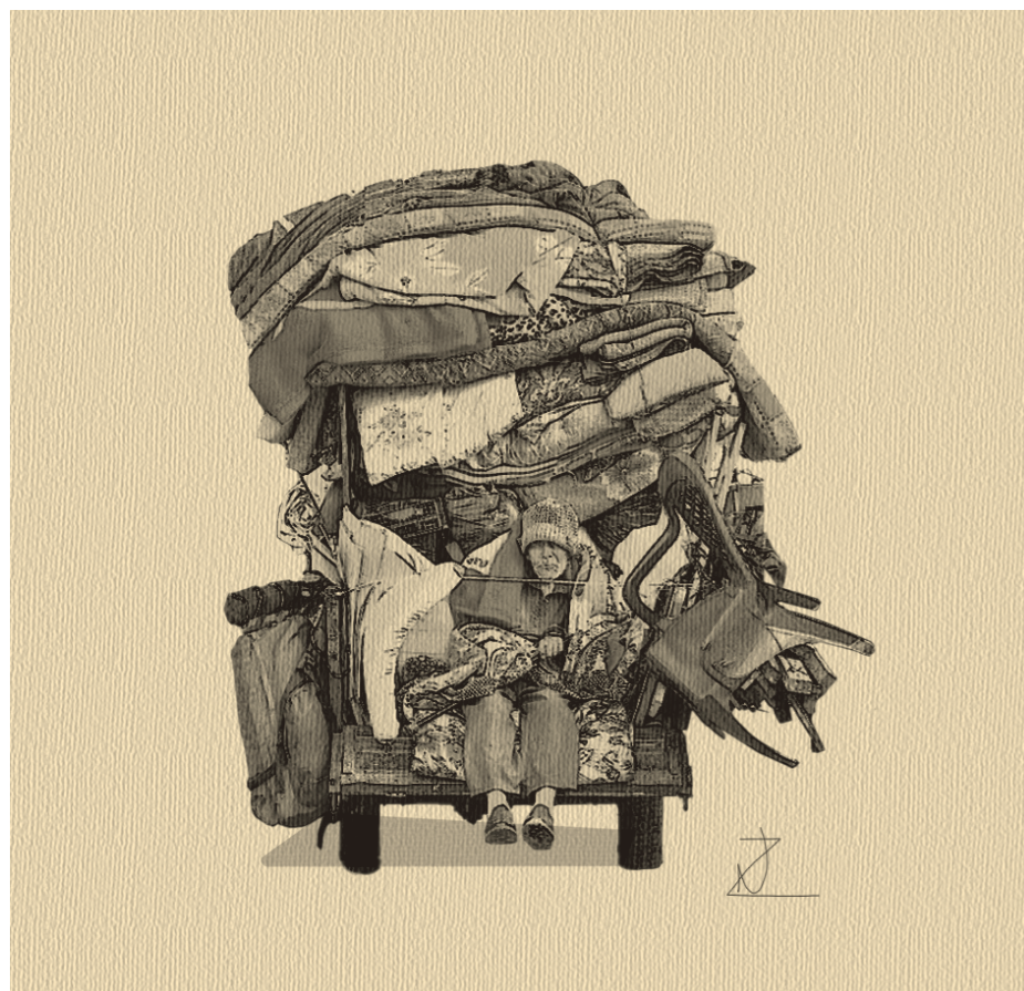
« My Homeland is Not a Suitcase and I am No Traveler », œuvre de Nour Ziada

Après quatorze ans de séjour en Suisse, Anlyn* bénéficie de l'opération Papyrus qui lui permet d'être régularisée. Le renouvellement de son permis est toutefois conditionné à l'obtention d'un diplôme de français de niveau A2. Malgré le suivi de cours de langue hebdomadaires, Anlyn* produit une attestation FIDE de niveau A1. Malgré 18 ans de vie en Suisse, et sans tenir compte des difficultés d'apprentissage liées à son âge (65 ans) et à ses problèmes de santé, le SEM refuse alors la prolongation de son autorisation de séjour et prononce son renvoi de Suisse.