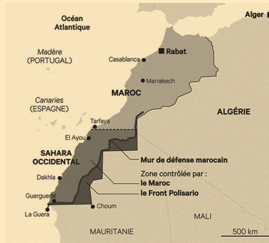
La situation au Sahara Occidental

Considéré par l'ONU comme l'un des derniers « territoires non-autonomes » au monde, le Sahara occidental (SO) est situé au cœur de l'Ouest saharien entre l'océan Atlantique, les fleuves Niger et Sénégal et au nord les reliefs de l'Atlas.