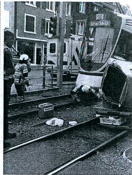
L'automobile a été fortement endommagée dans